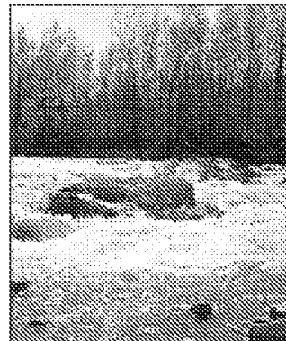
Una veduta del Secchia

Le iscrizioni si ricevono entro il 21 luglio; per prenotarsi o richiedere ulteriori informazioni il numero telefonico è 0522 267214.