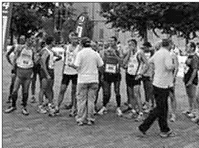
Il movimento podistico è sempre al lavoro

DOPODOMANI, a Baiso, i podisti scenderanno in campo per lo svolgimento della 25 a Camminata di San Lorenzo. Si tratta di una manifestazione sportiva ormai consolidata e che ha parecchi aficionados. Il programma prevede che alle ore 8 si dia corso al ritrovo dei partecipanti presso il Centro Civico di Baiso; la partenza verrà data alle ore 9 precise.